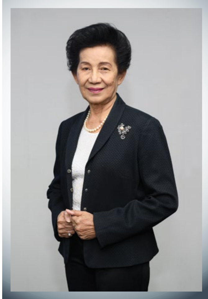
หม่อมหลวงเต็มแสง สรรพโส